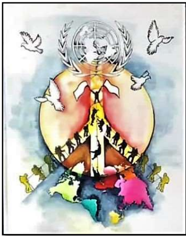
Η Αφίσα Ειρήνης που κέρδισε, από Κύπρο