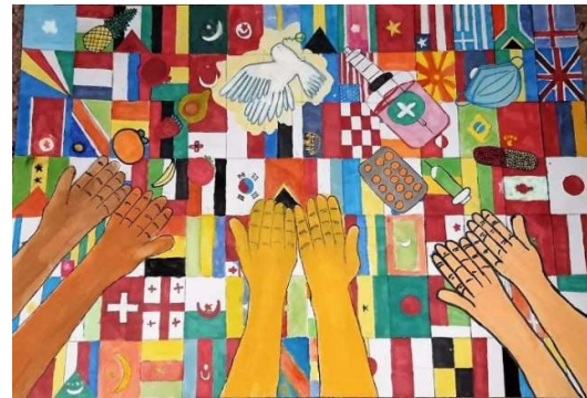
Η Αφίσα Ειρήνης από Βόρεια Ελλάδα

6 Δεκεμβρίου 2020: Οι Λέσχες LIONS που εδρεύουν στη Λεμεσό πραγματοποίησαν την αναβληθείσα λόγω των μέτρων κατά του κορωνοϊού εκδήλωση ενημέρωσης για τον Διαβήτη.