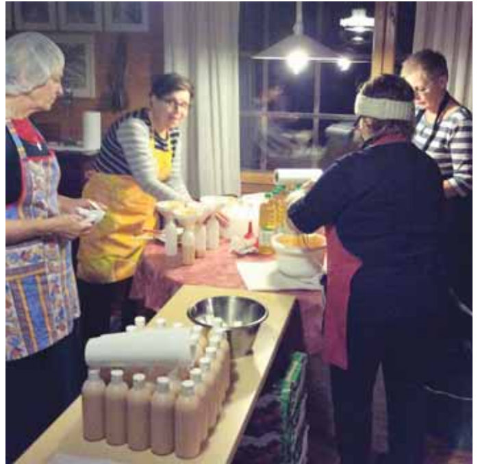
Tekijät Anneli Jetsu (vas.), Kaija Koponen, Marja-Liisa Ruotsalainen ja Eila Oittinen.