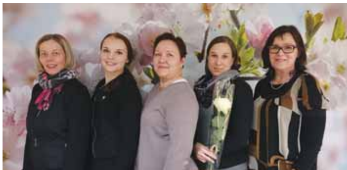
Uudet leijonat omenapuiden katveessa yritysvierailulla Saurumilla.