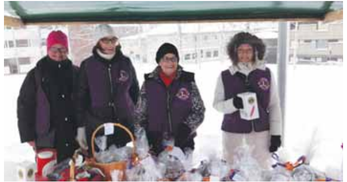
Minnan kakut tekivät kauppansa Tuomiokirkonmäen adventtimarkkinoilla.