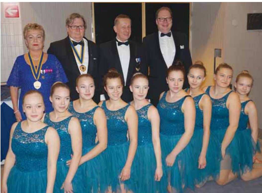
Klubien presidentit poseerasivat linan Kolibri-ryhmän kanssa.