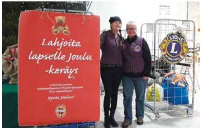
LC Canthin Lahjoita Lapselle Joulu -keräys Kuopion Prismalla jo 12. kertaa.