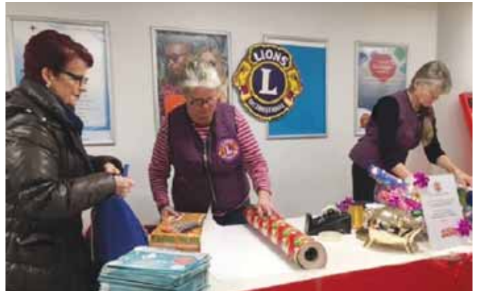
Näppäret otteet olivat tarpeen Partasen paketoitipisteellä.