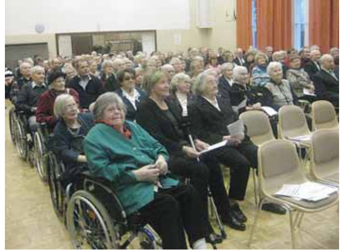
Juhlakonsertin yleisöä Mantun salissa

Tervon sotaveteraanien puolen vuosisadan juhlaohjelma tarjosi lioneille useita aktiviteetteja. Juhlakonsertti nuorisotalo Mantussa kokosi juhlaväkeä salin täydeltä. Viihdytysjoukkona vieraili jälleen Kenttäharmaa-orkesteri Pieksämäeltä aidoissa soittolavillaan. Kuultu, pääosin sota-ajan musiikki, sai muistot heräämään ja tunteet pintaan monella. Lionit vastasivat mm. kalustojen siirroista, liikenteen ohjauksista sekä naulakko-palveluista.