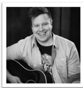
Markus Salo The Voice of Finland voittaja 2019