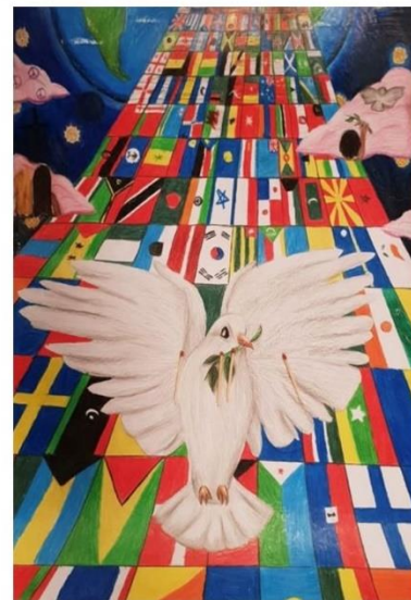
Suomen edustaja kansainväliseen kisaan