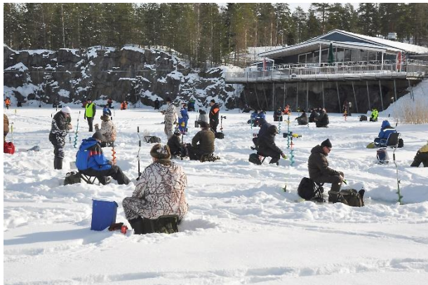
Leijonapilkkijät saivat nauttia aurinkoisesta säästä lohilammikon jäällä.