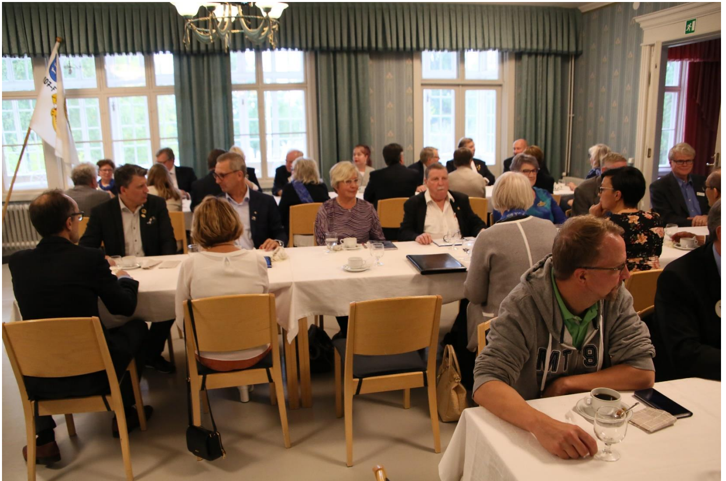
Piirihallituksen kokous Kauhajoella 7.9.2018.

Tavoite on tietysti kova, kun edellytin piirin kaikkien klubien nimittävän palvelujohtajan koska joissakin klubeissa edellinen presidentti toimii nykyisinkin tässä tehtävässä. Tarkoitus on kumminkin, ettei hallituksen kokoa kasvateta sen vuoksi, että GST nimitetään klubille vaan joku hallituksen nykyisestä virkailijasta ottaa tehtävän hoitaakseen.