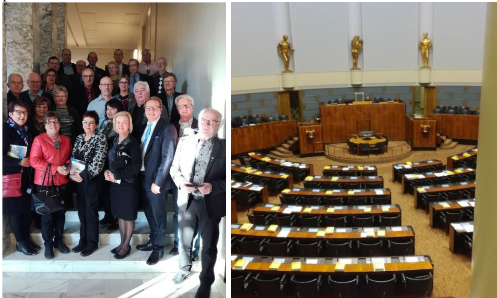
Kauhajoen klubit vierailulla Eduskuntatalossa.

K auhajoen lions-klubit: LC Kauhajoki, LC Kauhajoki/Aro, LC Kauhajoki/Päntäne ja LC Kauhajoki/Katrilli kävivät päiväretkellä Eduskuntatalossa. Retken järjesti LC Kauhajoki. Eduskunnan kyselytunti kuului myös ohjelmaan. Leijonia opasti kauhajokelainen kansanedustaja Lasse Hautala sekä eduskunnan puhemies Paula Risikko. Yhteinen retki koettiin onnistuneeksi.