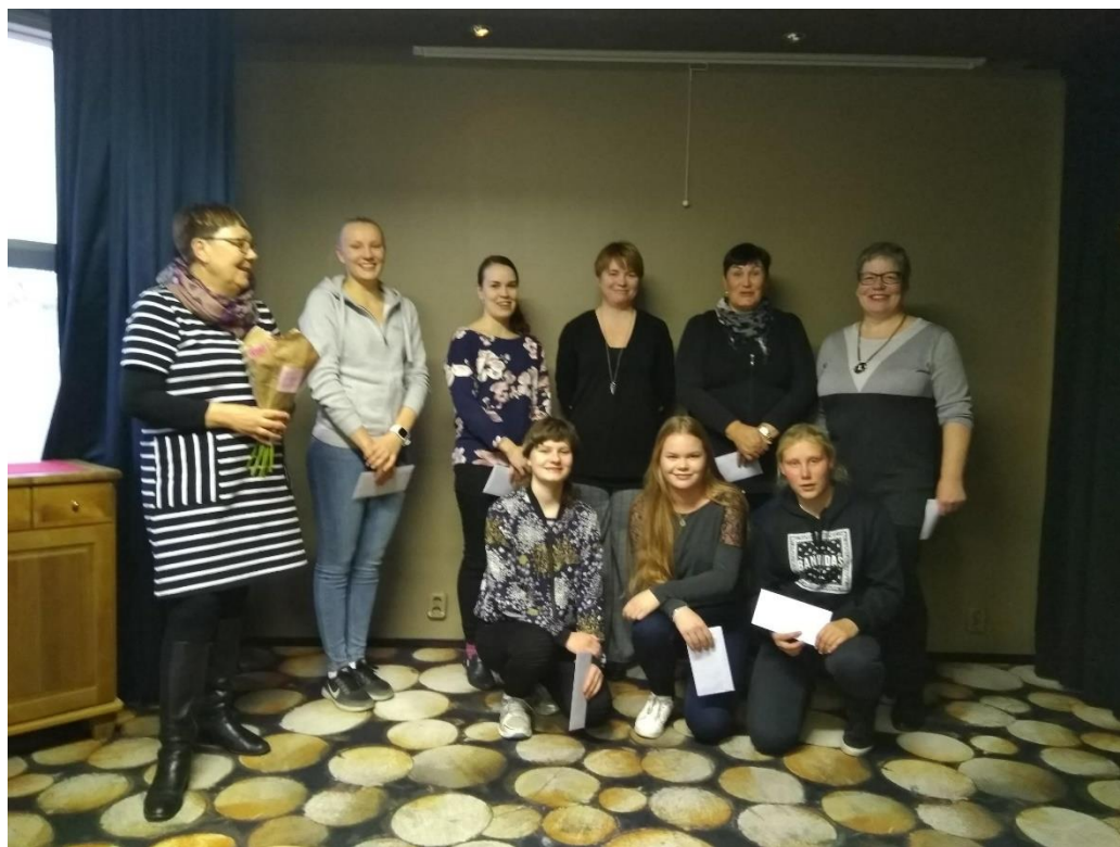
LC Alavus/Kuulattarien- ja taustajärjestöjen edustajat.