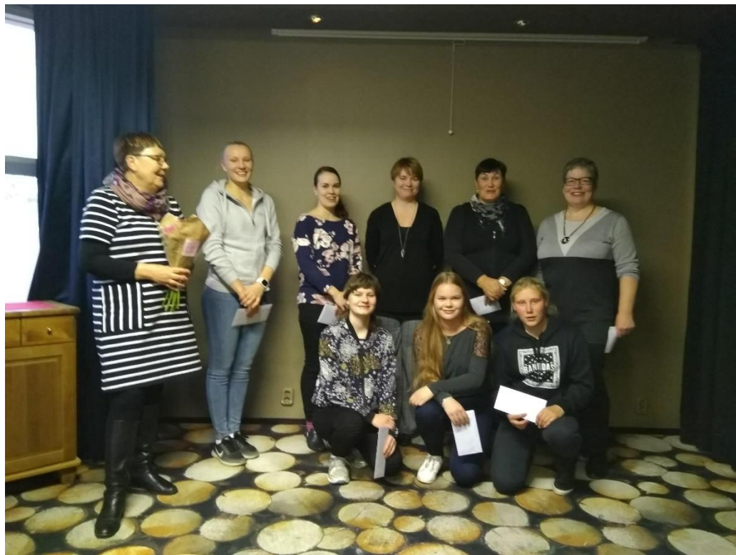
LC Alavus/Kuulattarien- ja taustajärjestöjen edustajat.