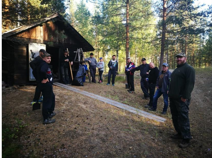
Kökkäväkeä nesteytystauolla Terwaladolla.

Lions Club Kuortaneen miehet päättivät syksyllä 2017 hakea paikalliselta Leader toimintaryhmältä Kuudesta