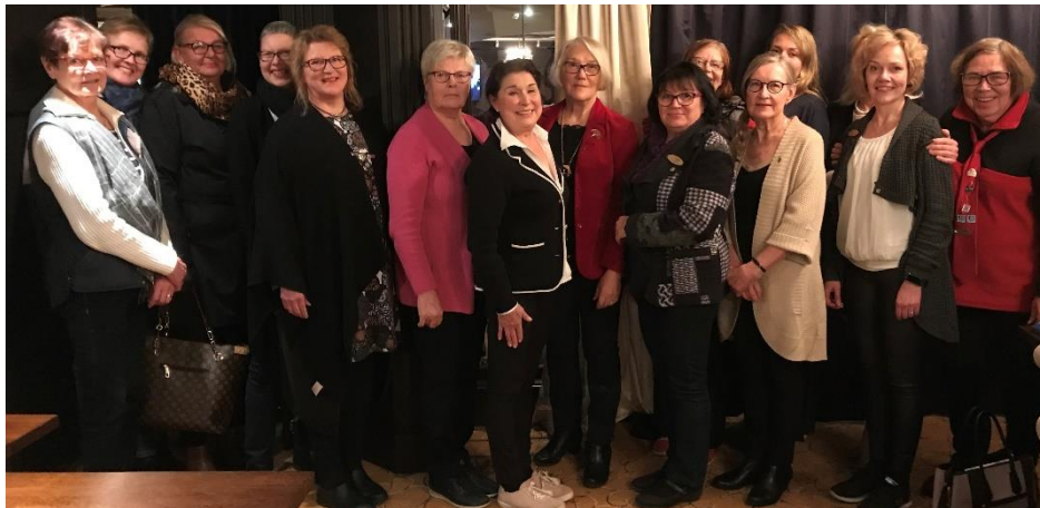
LC Seinäjoki/Aalto.