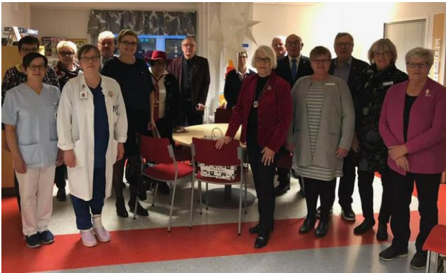
Diabetespäivän lahjoitus.

Tässä kuvassa meillä on komea joukko Seinäjoen alueilla toimivien klubien edustajia. Luovutimme 9 klubin voimalla, 14.11.2018, diabetespäivänä, Seinäjoen Keskussairaalan diabetesyksikön henkilökunnalle 65 pääsy- ja välipalalippua, Doodson Activity Parkiin, Hoplopiin ja Squash & Bowling Centeriin. Doodson Parkiin tarvittiin myöskin, turvallisuussyistä, liukuestesukat. Liput henkilökunta jakaa tapaamisten yhteydessä potilailleen. Toiveen liikuntalipuista esitti diabetesyksikön