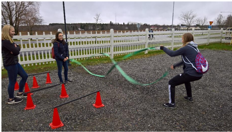
Ulkoliikunnan riemua yksinkertaisella välineellä.

Tapahtuman tarkoituksena oli innostaa nuoret liikkumaan, hetkeksi irti älypuhelin, pelien ja somen maailmasta. Teemapäivän luennoitsijaksi oli saatu alan asiantuntija psykologi Christoph Treier.