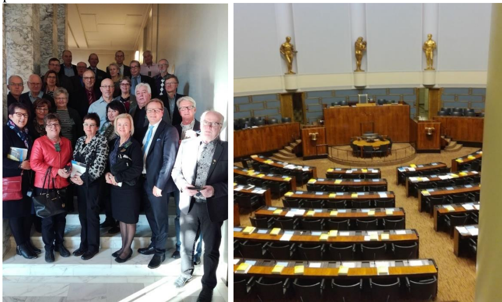
Kauhajoen klubit vierailulla Eduskuntatalossa.

K auhajoen lions-klubit: LC Kauhajoki, LC Kauhajoki/Aro, LC Kauhajoki/Päntäne ja LC Kauhajoki/Katrilli kävivät päiväretkellä Eduskuntatalossa. Retken järjesti LC Kauhajoki. Eduskunnan kyselytunti kuului myös ohjelmaan. Leijonia opasti kauhajokelainen kansanedustaja Lasse Hautala sekä eduskunnan puhemies Paula Risikko. Yhteinen retki koettiin onnistuneeksi.