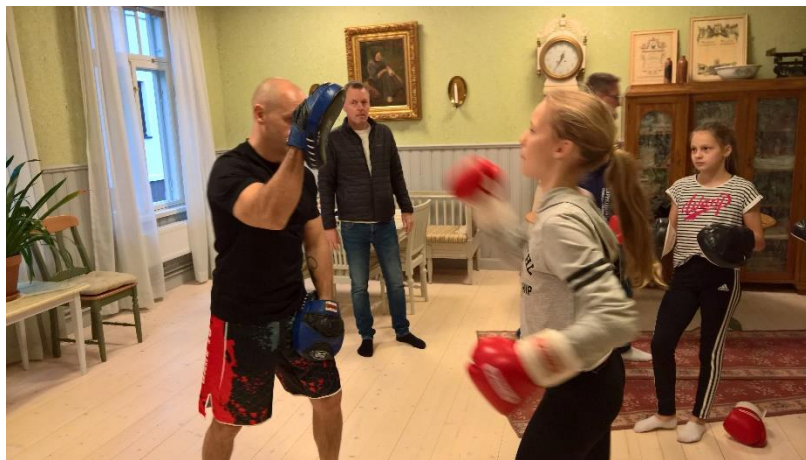
Uisäliikunnastakin voi löytää uusia lajeja.

Kaikille oli välipalaksi tarjolla mm. paikallisesti tuotettua puolukkakaurajuomaa sekä kirsikkatomaatteja ja he myös osallistuivat arvontaan jossa kaikille riitti palkintoja ja pääpalkintoina aktiivisuusrannekkeet yksi pojille ja yksi tytöille.