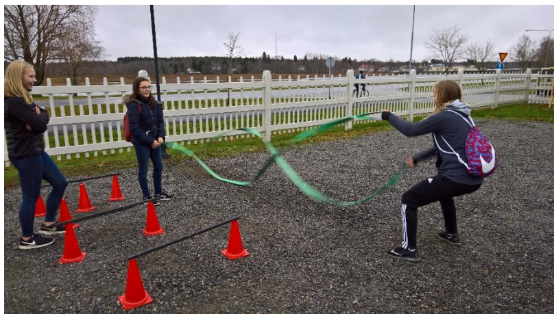
Glädjen av utomhus träning med ett enkelt verktyg.

De två firande lionsklubbarna LC Kristinestad – Kristiinankaupunki (nr 3 i Finland) och LC Lappfjärd –