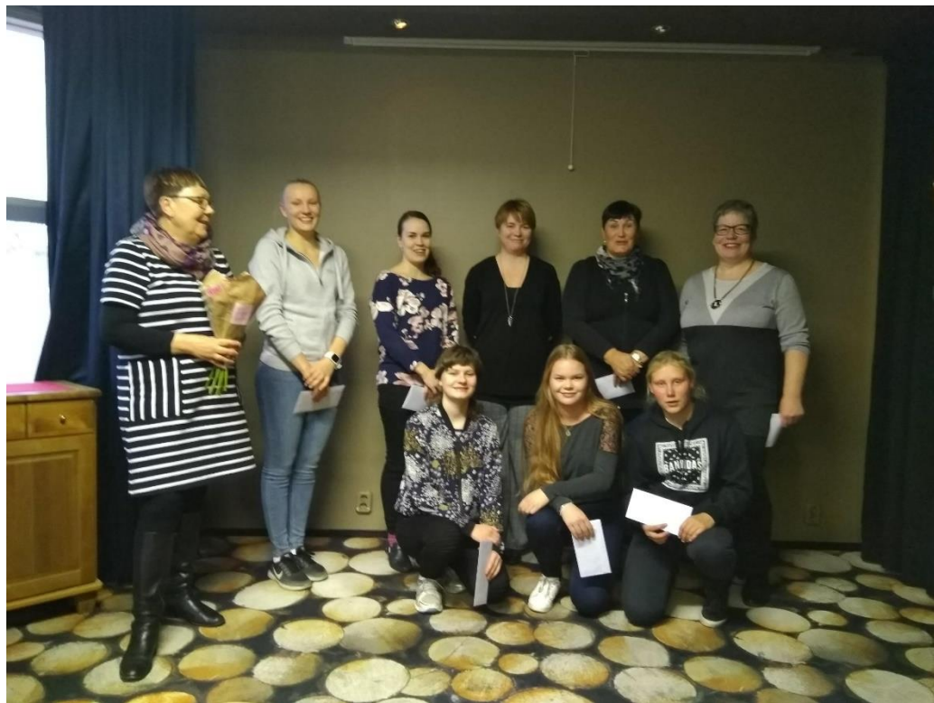
LC Alavus/Kuulattarien- ja taustajärjestöjen edustajat.