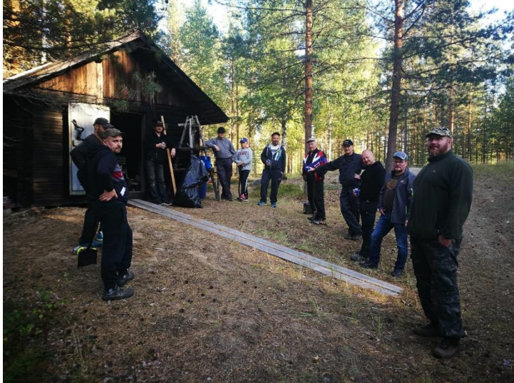
Kökkäväkeä nesteytystauolla Terwaladolla.

Lions Club Kuortaneen miehet päättivät syksyllä 2017 hakea paikalliselta Leader toimintaryhmältä Kuudesta