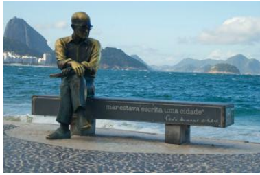
Estátua de Carlos Drummond – Copacabana (RJ)