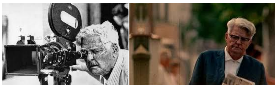
O que é Cinema? Cinema é cachoeira! - Humberto Mauro

A eletricidade começava a ser instalada nas cidades do interior: essa revolução tecnológica fascinou o rapaz. Seu primeiro trabalho foi instalar eletricidade em fazendas e sítios locais. Ele também construiu o primeiro aparelho de receptor rádio em Cataguases.