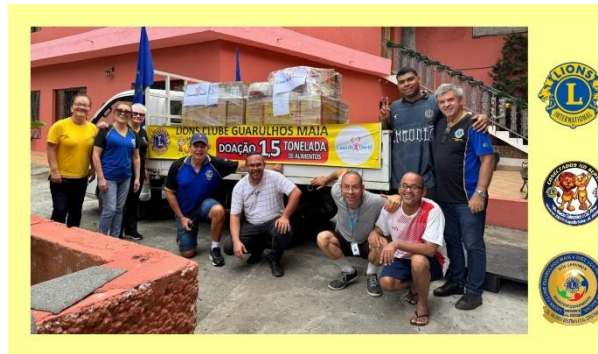
1500 kg Casa de David