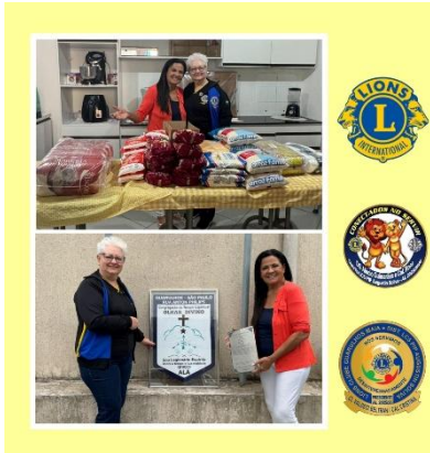
120 kg para Congregação do Templo Espiritual