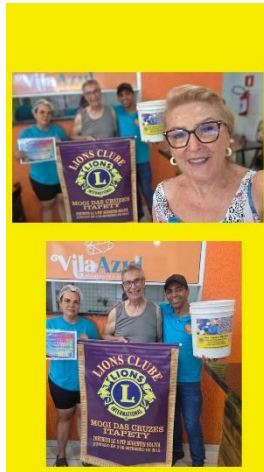
Mirante e Nete