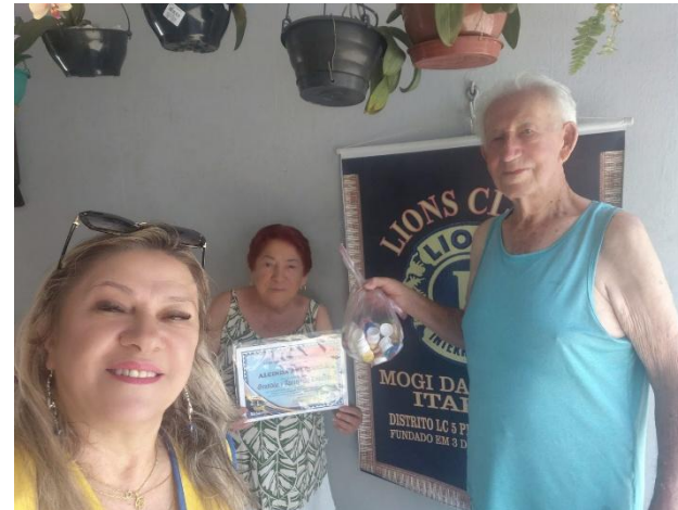
para este querido casal