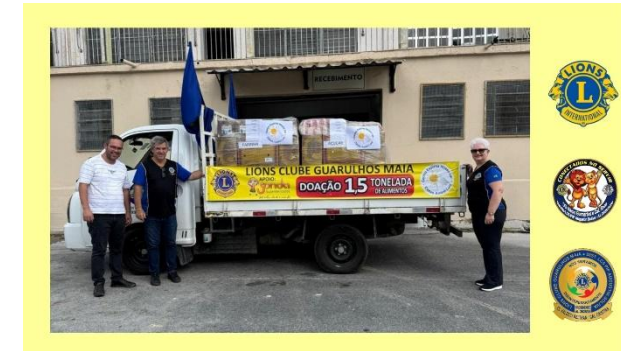
1.500 kg Casas André Luiz