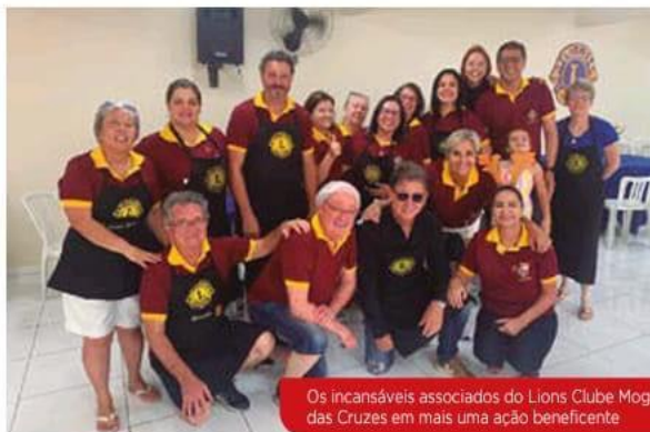
Os incansáveis associados do Lions Clube Mogi das Cruzes em mais uma ação beneficente