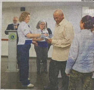
PARCERIA. Prefeitura destaca impacto positivo na vida das pessoas

Os alunos que participaram da ação passaram por consulta oftalmológica, recebendo diagnóstico apresentado por um profissional, como primeiro passo para obter óculos adequados. Em seguida foram recebidos em óticas para escolha das armações que mais se adequaram a cada um.