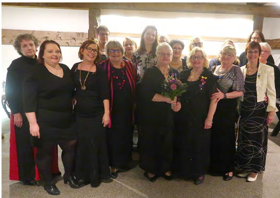
Energiset ja iloiset naisleijonat juhlatunnelmissa

Ewe-klubin toiminta painottuu erityisesti Vaajakosken alueelle.