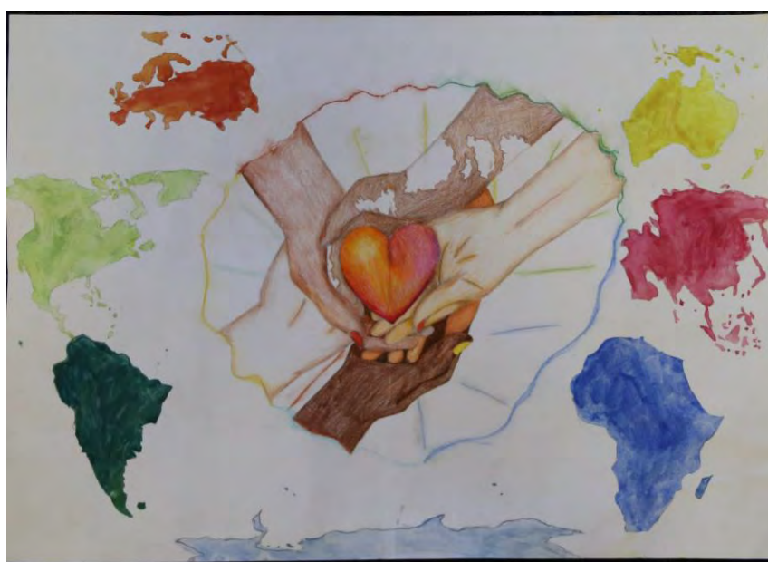
Piiri 107-G vuoden 2019 rauhanjulistekilpailun voittaja Elli Sipponen Koskenpään koulu