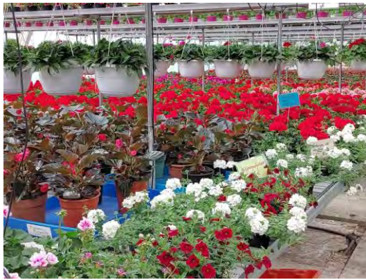
Puurusen Puutarha Uuraisilla