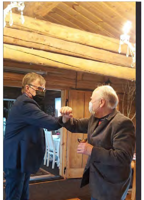
Lions Club Uurainen