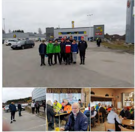
Lions Club Muurame