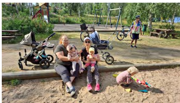
Leikkikenttä oli ahkerassa käytössä