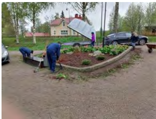
Puiston Leijona-kolmion kevät-kunnostus toukokuussa