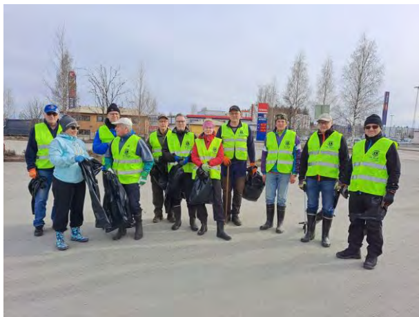
Kulmat Kuntoon Palokassa

Myös vuoden leijonavalinta poikkesi tavanomaisesta. Presidentti valitsi kauden 2020-2021 vuoden leijoniksi kaikki klubin leijonat yhdessä. Poikkeusvuodesta selvittiin hyvällä yhteistyöllä ja näin jokainen leijona on tunnustuksen arvoinen. Klubissa on hyvä henki ja jokainen tuo kekon oman tärkeän panoksensa. Kanadan maljan tavoin hylsy kiertää kiertopalkintona veljeltä veljelle.