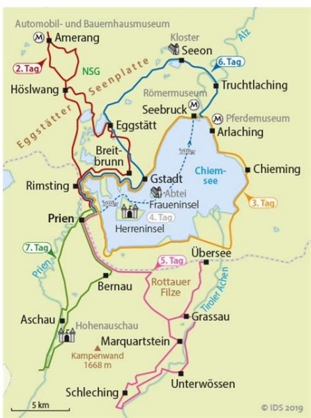
Radweg um den Chiemsee Karte. Rundweg Chiemsee Radweg Karte. Chiemsee Radweg Karte PDF.